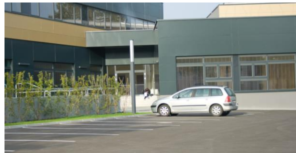
Die Schule (links); Parkplatz und Turnsaaleingang (rechts)